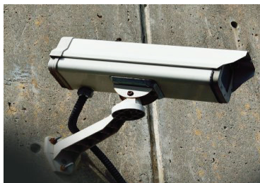
Sistemas de Segurança